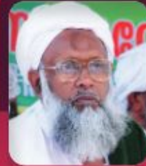
MT ABDULLA MUSLIYAR