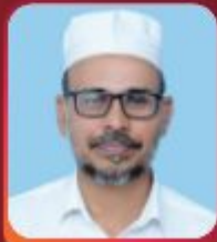
MP ABDURAHMAN MASTER